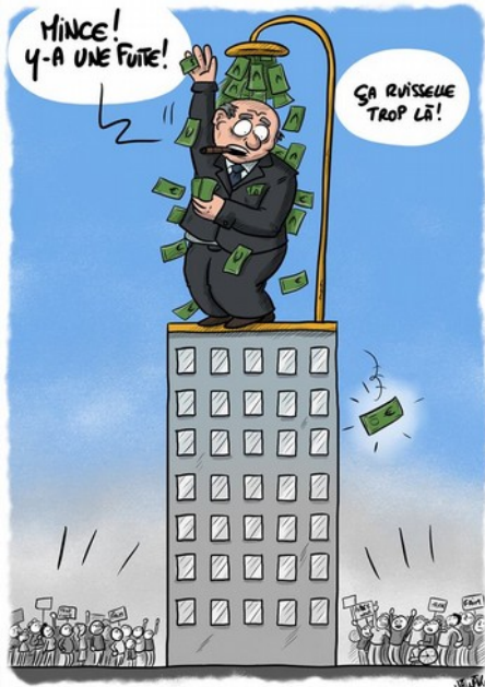
LA THÉORIE DU RUISSELEMENT EN ÉCONOMIE

La théorie du ruissellement en 3 dessins !